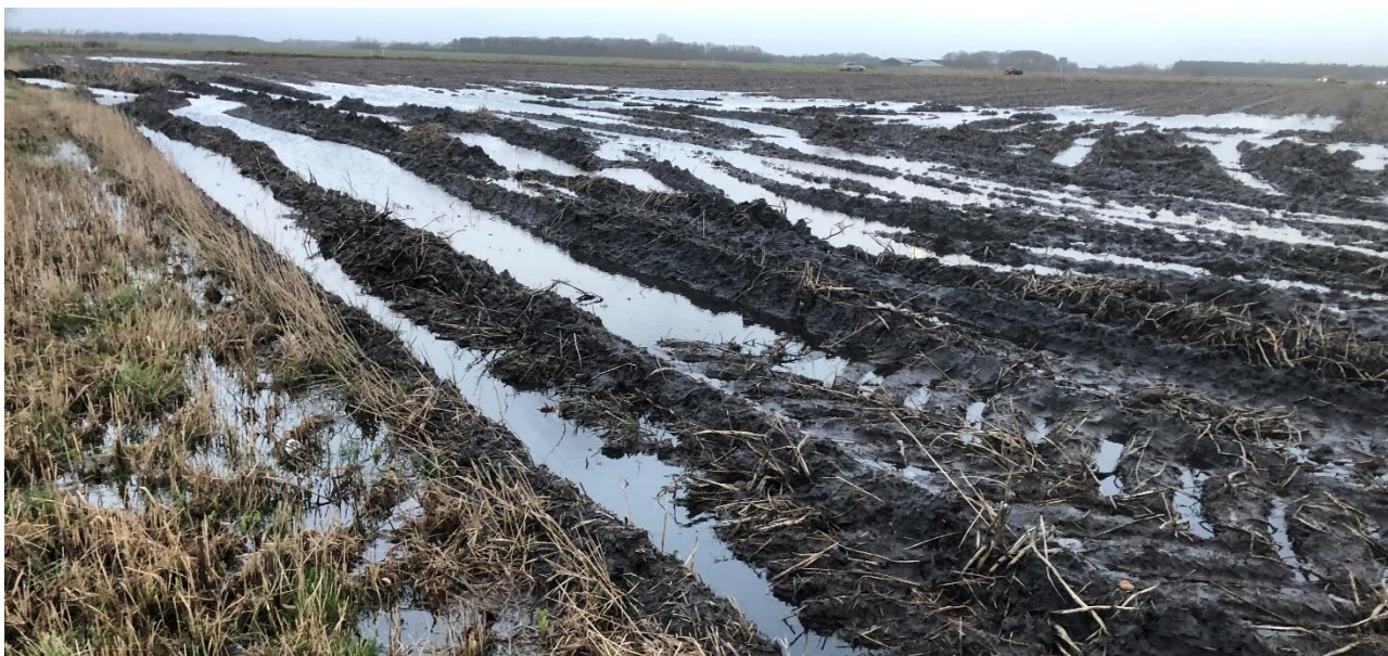
Dybe spor efter optagningen

En positiv udvikling i år har dog været, at der på trods af, at der stort set kun er høstet fugtige kartofler, kun har været tale om enkeltstående tilfælde af opbevaringsproblemer med melkartoflerne.