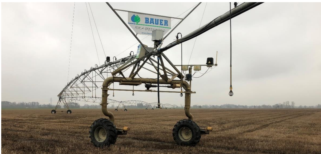
Center-pivot anlæg fra Sverige

Større læggeafstand! Blev i stor udstrækning anvendt. Forudsætningen for at kunne lægge med større afstand er selvfølgelig, at der er tale om gode sunde læggekartofler. Dernæst skal der være en mark, hvor der er en lang vækstsæson forude, hvilket vil sige, at kartoflerne kan lægges tidligt, og at de kan vokse minimum til slutningen af september. På mange arealer anvendes der typisk 18 hkg læggekartofler pr. ha imod en normal dansk norm på 23 hkg/ha. Det skal dog siges, at læggekartofler er dyrere i Sverige end i Danmark, og dette retfærdiggør et lavere læggekartoffelforbrug og lidt lavere udbytte. I Danmark har vi tidligere lavet forsøg med plantetal, som viste, at ved tidlig høst (1. september) var det økonomisk optimalt at anvende op til 30 hkg/ha, mens der ved høst omkring 1. oktober kunne anvendes fra 18-23 hkg/ha med ca. samme resultat.