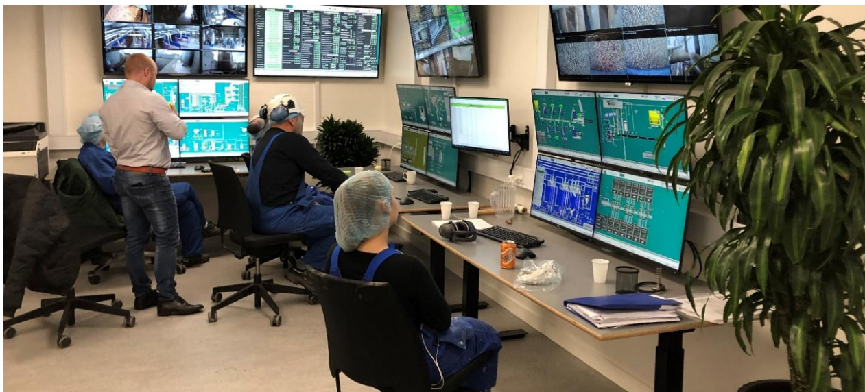
Det nye kontrolrum i stivelsesfabrikken

Det bliver rigtig spændende at få kontinuerlig drift i den nye fabrik og se, hvordan hele systemet fungerer under stabile forhold med en langt større mængde kartofler, og først når vi har oplevet det, kan vi fejre projektet. Dog tillader vi os allerede nu at sige, at det ikke er "helt skidt", når man ser på tidsplanen og budgettet.