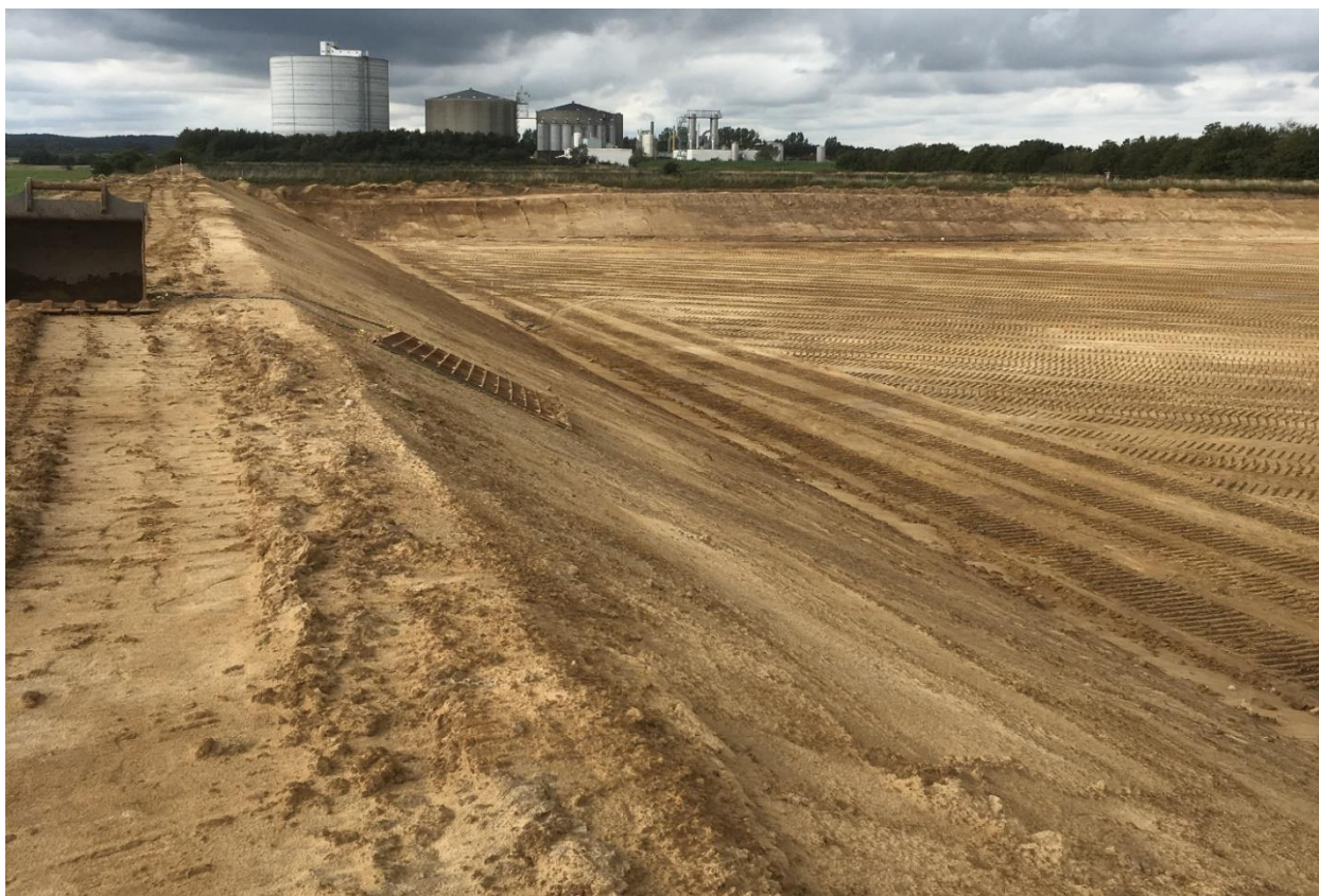
Udgravningen til den nye lagune er godt i gang

Den nye lagune bygges på et ca. 2 ha stort areal, hvor jorden i midten er skubbet ud i siderne. Derved dannes der en vold på omkring 5 m i højden på den indvendige side. Lagunen bliver drænet i midten for at sikre, at evt. grundvand ikke kan stå op i midten af lagunen, når den er tom. Samtidig vil drænet også kunne fungere som et sladretræn ved utætheder. Lagunen bliver herefter foret. Først med geotekstil og til sidst med en gummimembran, der er svejset sammen i baner. Arbejdet med at få foret lagunen forventes opstartet efter 1. oktober 2019, og lagunen forventes at kunne tages i brug i løbet af november 2019.