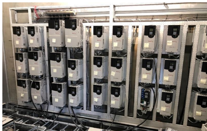
Der skal strøm til

Kapacitetsudvidelsen går planmæssigt, og vi ser stadig frem til en sommer med masser af aktivitet på fabrikken.