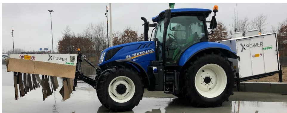
Strøm til nedvisning af kartofler?

Alternativet hertil er mekaniske løsninger. 2019 vil blive brugt til at undersøge forskellige mekaniske løsninger, som rækker lige fra afbrænding af top, strøm til at dræbe top, toptrækning i forskellige former, aftopning og overskæring af toppen mv., og som kan være mulighederne fremover. Fælles for de mekaniske løsninger er, at de er tidskrævende, og at der pt. ikke fundet nogen, der er helt effektive. De fleste mekaniske løsninger kræver en fast, stabil og ensartet kam – ja, én udfordring kommer sjældent alene.