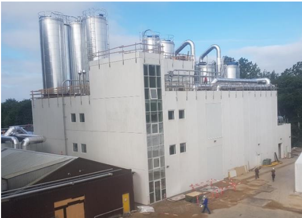
Den nye fabrik Starchify

Så kom dagen, vi har ventet på det sidste 1½ år. De første produkter er blevet produceret på den nye modificeringsfabrik sammen med Cargill. Desværre måtte vi i efteråret 2017 også se ind i et forøget budget, da det tidligt stod klart, at nogle af fabrikselementerne ville blive dyrere end først ventet. Det betyder, at fabrikken ender med en samlet pris på ca. 160 mio. kr. mod de originale 140 mio. kr.. AKV og Cargill arbejder sammen om en række initiativer for at forbedre investeringen og dermed sikre, at det øgede budget ikke går ud over den forretningsplan, som blev lagt fra starten.