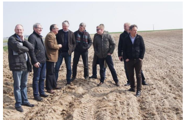
Bestyrelsen i marken

Det var interessant, at der fortsat tegner sig nye muligheder på kartoffelstivelsesområdet til trods for, at kartoffelstivelse samlet set fylder meget lidt i Cargill's store stivelsesforretning. Nye laboratorier blev vist frem, og det var imponerende at se den udvidelse, der er sket på det anvendelsestekniske område, siden bestyrelsen sidst var på stedet.