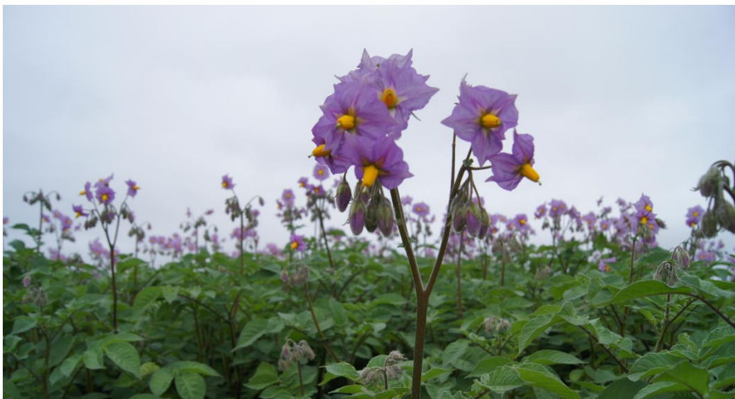
Potentiale for vækst

Vi håber meget, at vore tiltag vil lykkes.