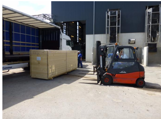
Modtagelse af ny dekanter fra GEA til vaskeriets vandrensning

Den samlede investering omfatter ca. 1,4 mio. kr. og udgør ca. 10% af den oprindelige tekniske installation.