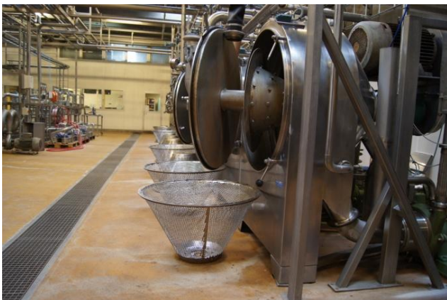
Renovering af sier i fabrikken

Produktionen af papirstivelserne har gennem hele 2011 været fastholdt på et meget konstant volumen og med en meget flot driftsstatistik. Glædeligt er det, at vi i 2012 kan forvente en tilsvarende efterspørgsel på et lidt højere niveau, men priserne er til gengæld faldet.