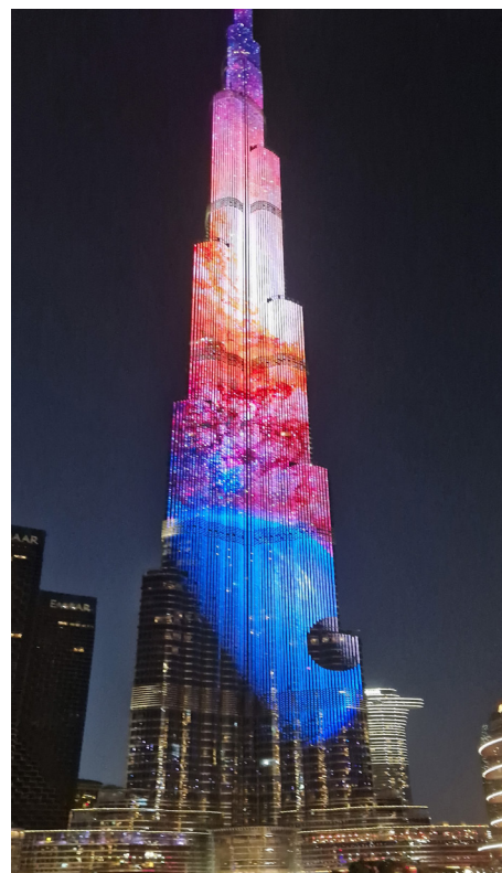
Billeder af fragile bygninger i Pakistan og flotte skyskrabere i Dubai