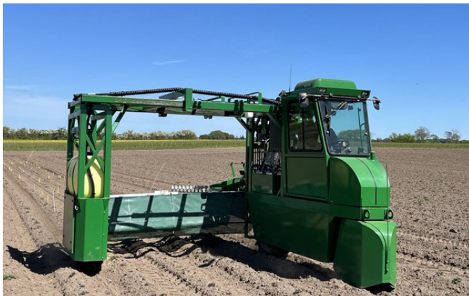
Forsøgssprøjten er købt sammen med LandboNord

Med den nye sprøjte håber vi på at kunne lave et nyt forsøgs set-up til test af biostimulanser, og de mange andre tilsætningsstoffer, der bliver promoveret til kartofler uden den nødvendige dokumenteret virkning.