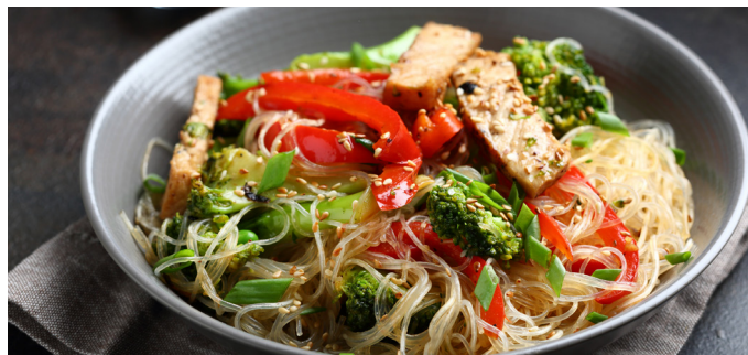
Derivater kan blandt andet bruges i nudler

Produkterne fra den nye fabrik kan anvendes i en meget bred vifte af fødevarer, men grundlæggende kan man med en derivatfabrik påvirke viskositeten af de endelige produkter. Det kan med andre ord siges, at vi med fabrikken kan få evnen til at tykne eller ændre konsistensen af det endelige produkt. Et eksempel kan være gelatine til vingummi, som kan erstattes af en modificeret stivelse, som kan give samme konsistens men uden animalske proteiner. Dette er ligeledes en fordel, da animalske proteiner er dyre, hvorfor den billigere modificerede stivelse bidrager til, at flere kan have råd til at købe disse fødevarer. De nye produkter, der skal fremstilles, tager både tid at udvikle og teste ude ved kunden. Derfor må det forventes, at der går 1-2 år fra, at fabrikken står klar, til der kommer gang i salget af de mest funktionelle og spændende stivelsestyper. Så der er en længere tidshorisont, men det er et projekt, vi har stor tiltro til på AKV.