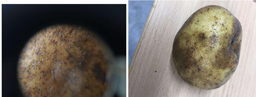
Fotoet viser en knold med mørke områder, der er et udslag af angreb af Black Dot og et nærbillede, hvor man kan se de karakteristiske microsclerotier fra Black Dot