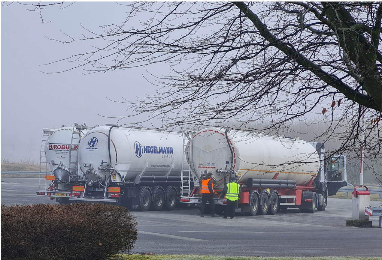
Tankbilerne holder i kø på AKV for at hente stivelse.

Vi har normalt et vist held med at "læse" markedet på kort og mellemlang sigt, men vi må indrømme, at verden i øjeblikket er særdeles uforudsigelig. Situationen omkring Ukraine kan hurtigt ændre sig, og det samme kan energipriser, kornpriser, m.v.