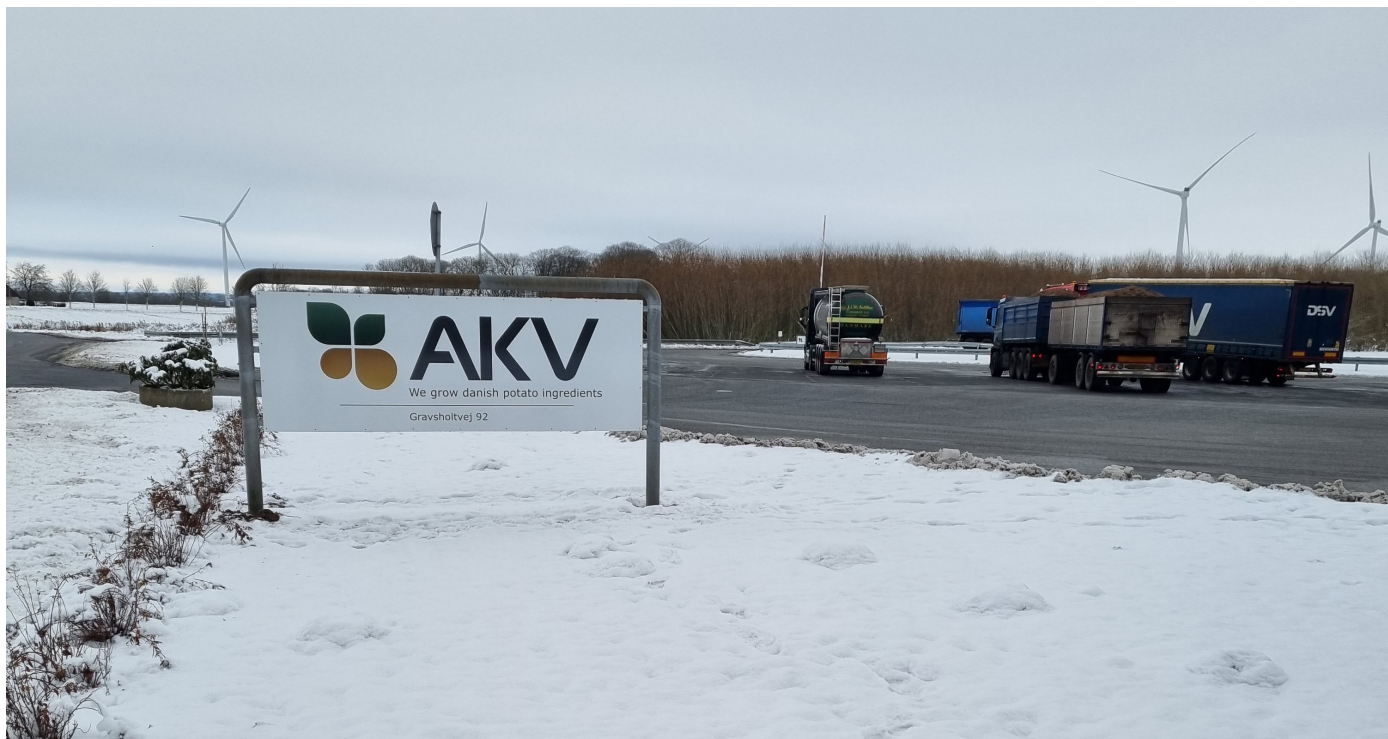
Velkomstsiltet ved vejen er skiftet ud