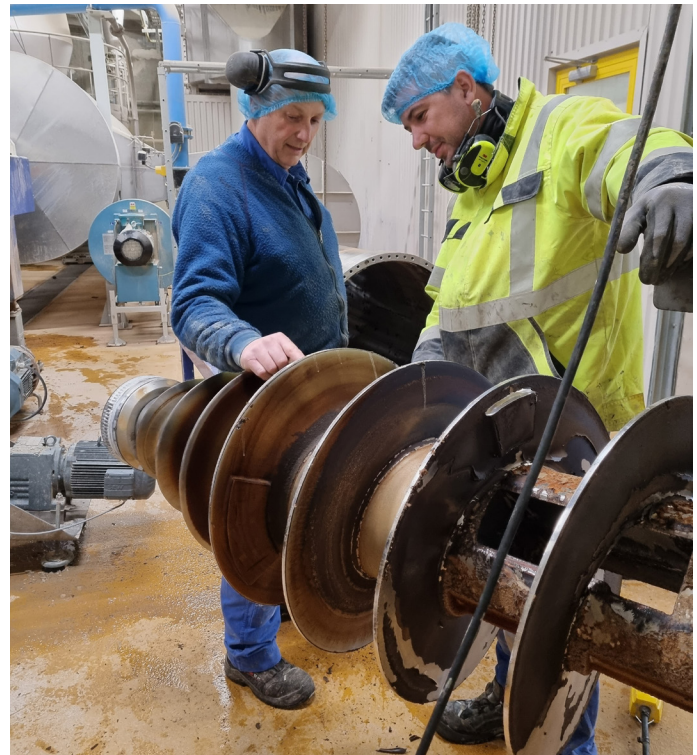
På rengøringsdage er der tid til at få service ret dele af anlægget

Udover samarbejde er det også vigtigt at få en god start på opgaven. "Det er vigtigt at komme med en positiv stemning. Det betyder meget. Er vi ikke positive, så får vi ikke alt den information, vi skal