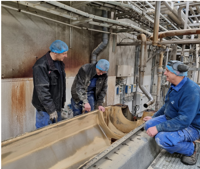
Altid godt at få et ekstra sæt øjne på opgaven

Opsummerende bliver teknisk afdeling kort forklaret således: "Det er os der skal løse problemet, lige meget hvad der er, så er det os folk kommer til. I det overordnet billede er det os, der servicerer alle afdelinger i virksomheden".