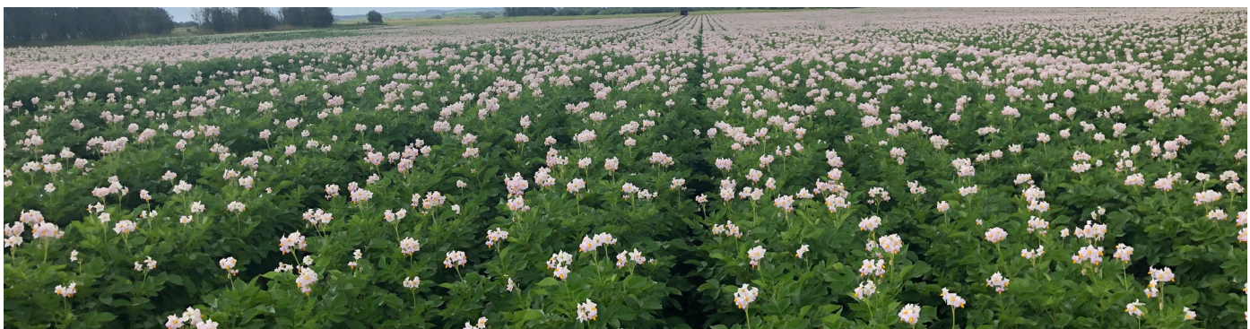
Fyone i blomst

Udbyttet i Fyone er over udbyttet i Kuras. Det viser forsøg i flere år både på den lette j1 jord i Midtjylland og på Nordjysk sandjord ved Dronninglund. Erfaring tyder på, at sorten også klarer sig godt under uvandede forhold. Stivelsesprocenten er middel, og udover en særdeles høj skimmelresistens har Fyone resistens mod den almindelige kartoffelbrok type 1. Skal der nævnes svagheder ved Fyone, så kan den danne hule knolde, og den er langsom til at blive skindfast. Det sidste betyder, at den formodes at være mindre egnet til lagring i hus, hvor tørring kan tage for lang tid. Fyone har et relativt lavt N-behov.