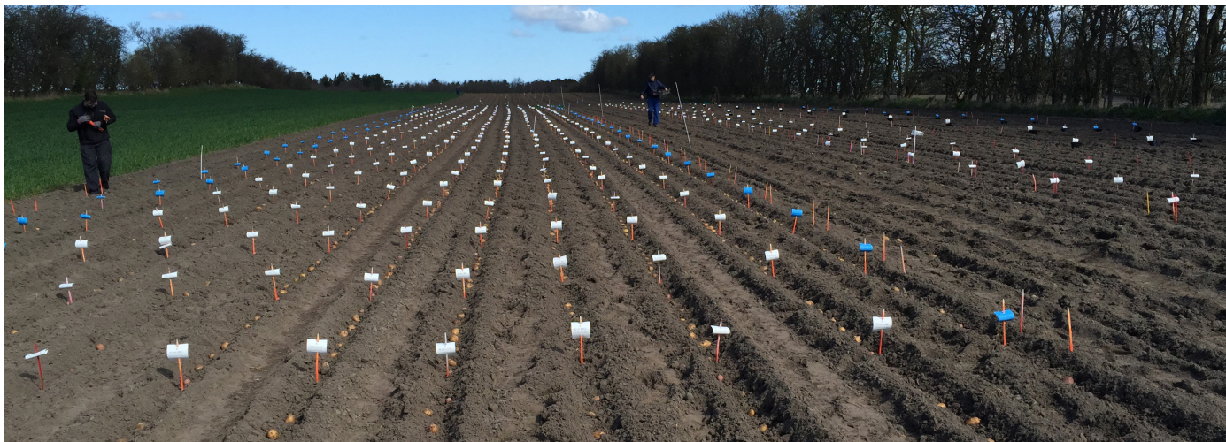
Lægning i forædlingsmarken

AKV fik Nofy på sortlisten i 2017, og Fyone er kommet med i år. De to første sorter har kun et enkelt gen for skimmelresistens, men i fremtidens kloner er der mulighed for 2 eller flere resistensgener. Så vi håber, at vi ser ind i en lovende fremtid med flere nye sorter på listen.