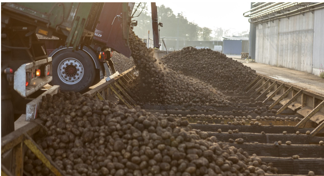
Kartofler bliver aflæsset i graven

Den indkaldte mængde vil fremover blive i rene kartofler. Dette sker for at sikre, at avlere, der f.eks. har mange sten, ikke kommer for langt bagefter med leverancerne ift. de øvrige avlere. Smudspræmie/bidragssystemet vil også blive ændret således, at der vil være tale om lidt mindre præmie og lidt mere bidrag. Dette skyldes, at der ikke er fornuftig sammenhæng mellem, hvad vi betaler i præmie og vores omkostninger til håndtering af smuds.