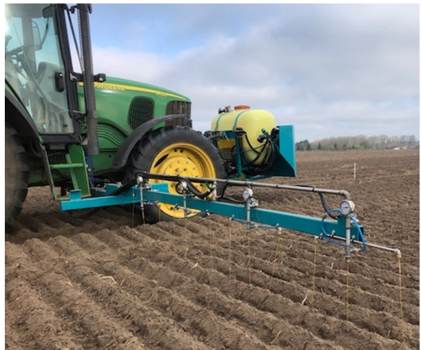
AKVs mini K-2 udlægger

Udover de officielle forsøg i marken er der som altid plads til nye spændende tiltag. Vi ser igen på bejdsemetoder Rullebord kontra hardbejdsning. Skimmelbehandling af læggekartofler efter nedvisning. Sorters tørkeristens mm.