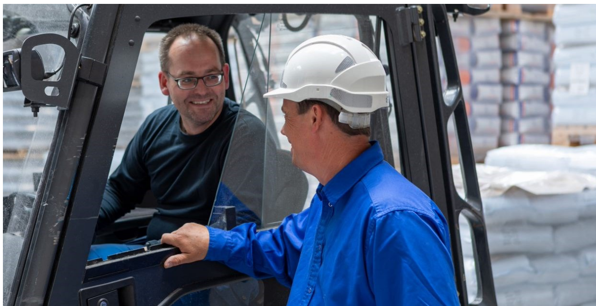
Udleveringen bliver holdt i gang med et smil

Siden vi på AKV har etableret vores egen salgsafdeling, er der sket meget. Vi fejrer den ene rekordudlevering efter den anden. Pølsevogn i januar, pølsevogn i marts og burgervogn i april. Hvad har dette egentligt betydet for manden på gulvet?